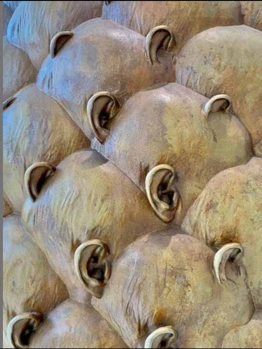
Sir Tony Cragg